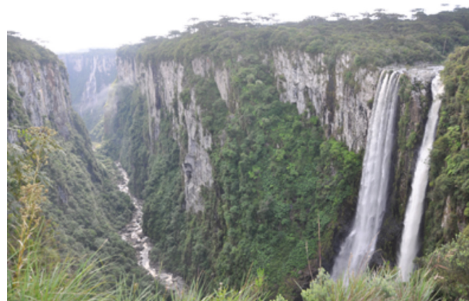
Figura 4: Cânion no parque da Ferradura, Canela (RS) (Foto: Hélio A. Duarte).

A civilização humana inicia a sua grande mudança tecnológica com a utilização da energia potencial das águas nas cachoeiras para fazerem mover rodas d'água. Por exemplo, nas fazendas antigas do interior do Brasil, ainda há vestígios