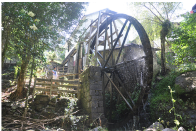
Figura 5: Moinho de água para fazer fubá e farelo de milho, município de Bento Gonçalves (RS). Esse moinho tem mais de 150 anos.

de moinhos d'água utilizados para fazer farelo de milho (Figura 5). No alvorecer da revolução industrial, a água foi utilizada para mover navios e trens com as máquinas a vapor. A água era aquecida até atingir o estado vapor que, por meio de uma engenhoca apropriada, fazia mover os pistões da máquina a vapor, levando desenvolvimento para regiões longínquas.