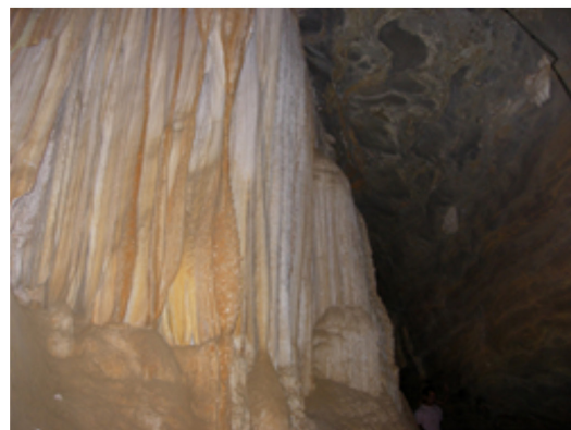
Figura 3: Estalactites e estalagmites da Gruta de Maquiné, Serra do Cipó (MG).