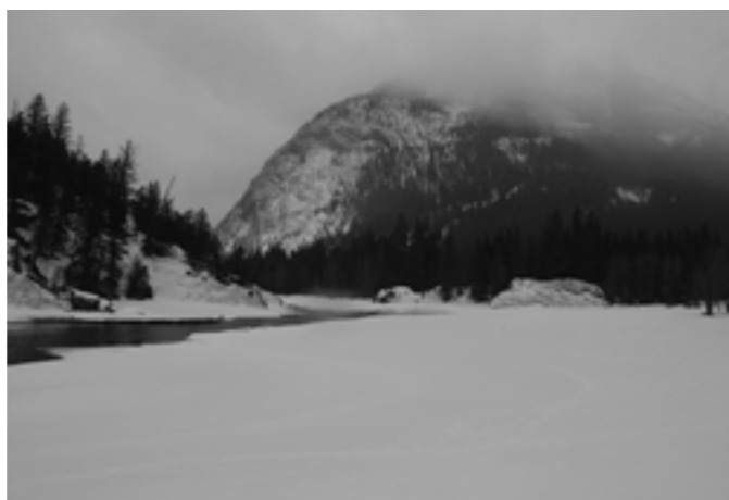
Figura 1: Diferentes vistas da cachoeira do rio Louise, Alberta, Canadá.