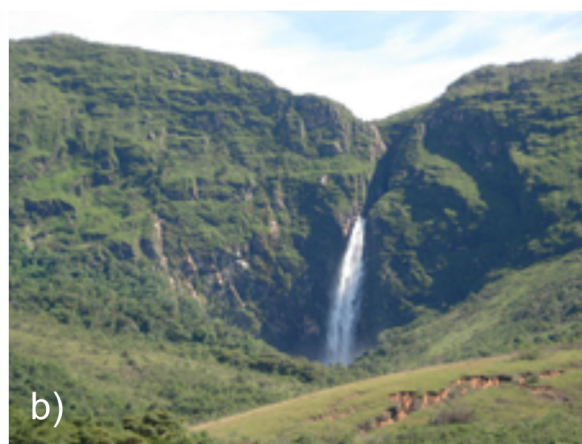
Figura 2: a) Cachoeira do Tabuleiro, Conceição do Mato Dentro (MG), a mais alta do estado de Minas Gerais; b) Cachoeira de Casca d'Anta, São Roque de Minas (MG).